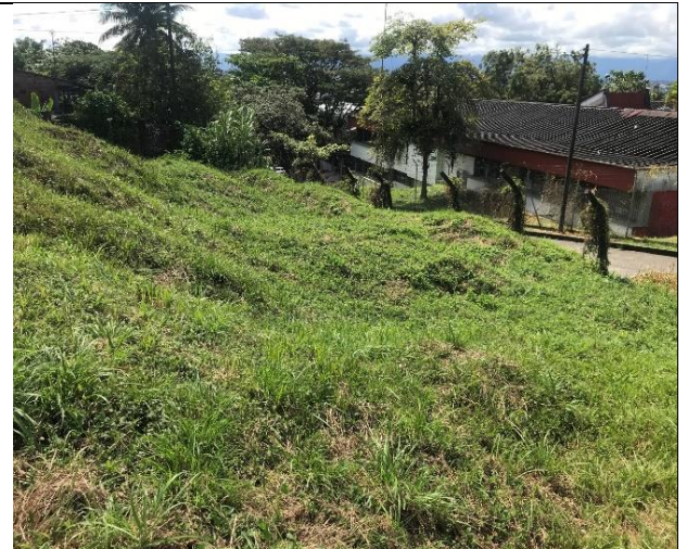
Fotografía 2 Área sujeta a intervención