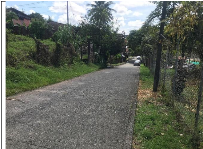
Fotografía 3 Panorámica Calle 10