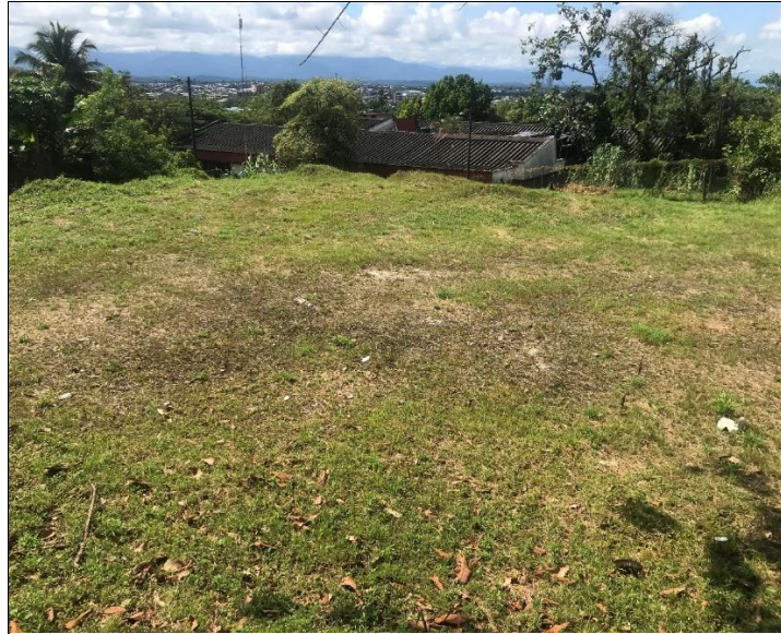
Fotografía 1 Panorámica del terreno sujeto a intervención.