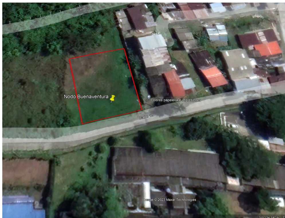
Imagen satelital No. 1