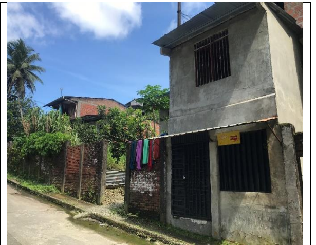
Fotografía 4 Viviendas del Barrio Doña Ceci