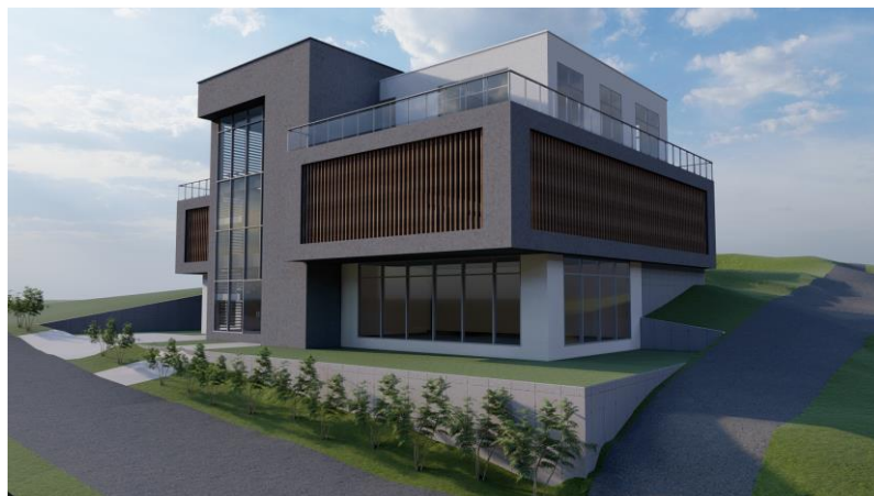
Imagen No. 2 Presentación Volumétrica

El proyecto distrito de innovación en el Nodo Buenaventura, es una edificación construida en niveles, con materiales duraderos, con un sistema estructural aporticado, cimentación en zapatas con vigas en concreto reforzado, mampostería tradicional (ladrillo), losas en steel deck, cubiertas livianas en Ecoroof, ventanería en aluminio, barandas de pasamanos y vacíos en acero, cortasol en pvc tipo madera entre otros materiales para acabados.