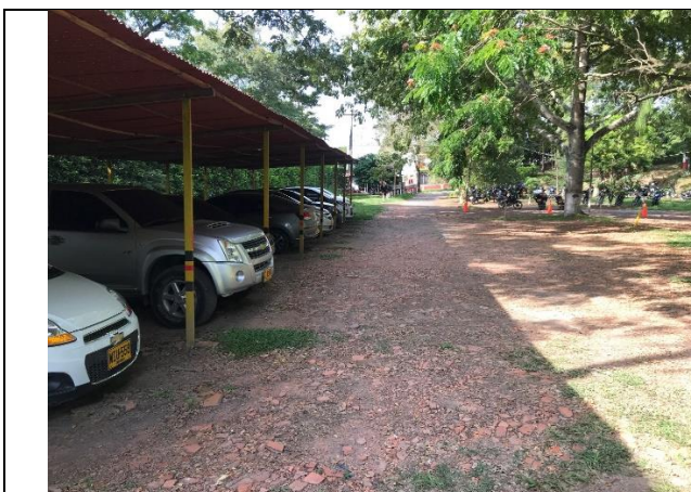
Fotografía 3 Zona de parqueadero contiguo al sitio de intervención

Los árboles presentes en la zona, corresponden a frutales, con CAP menores a 32.5cm, los cuales pueden ser aprovechado sin la solicitud de un permiso de aprovechamiento forestal.