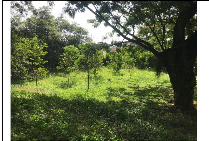
Fotografía 1 Panorámica del terreno sujeto a intervención.