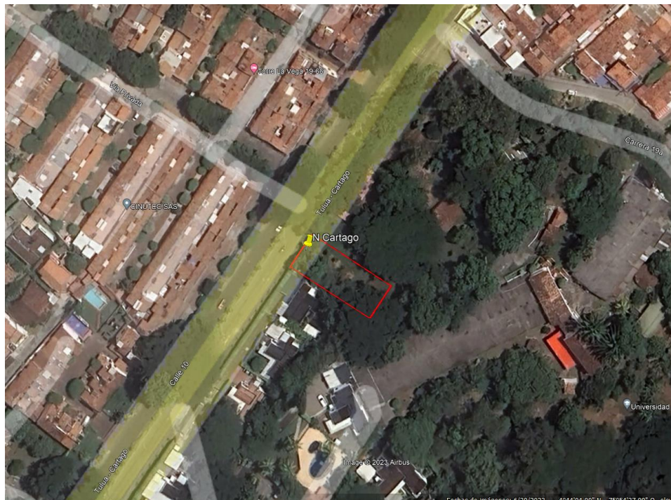
Imagen satelital No. 1