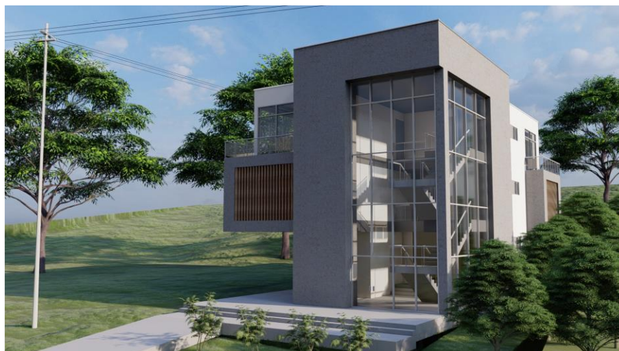
Imagen No. 2 Presentación Volumétrica

El proyecto distrito de innovación en el Nodo Cartago, es una edificación construida en niveles, con materiales duraderos, con un sistema estructural aporticado, cimentación en zapatas con vigas en concreto reforzado, mampostería tradicional (ladrillo), losas en steel deck, cubiertas livianas en Ecoroof, ventanería en aluminio, barandas de pasamanos y vacíos en acero, cortasol en pvc tipo madera entre otros materiales para acabados.