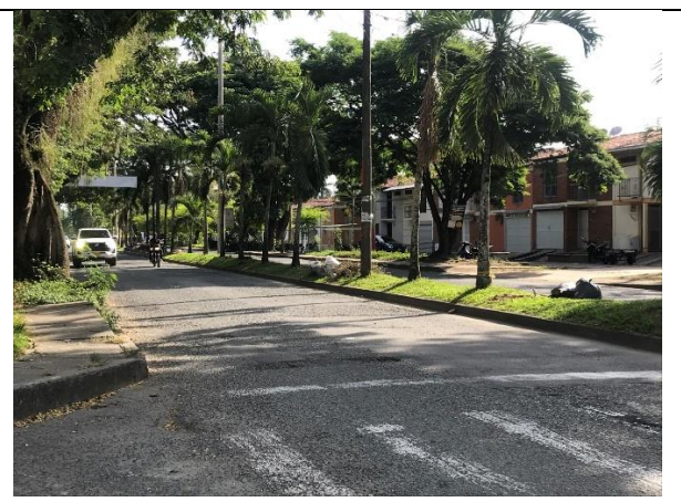
Fotografía 4 Panorámica calle 10 y Barrio Torre la Vega.