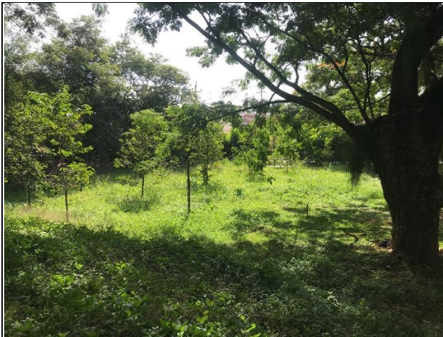
Fotografía 2 Área sujeta a intervención.

A continuación, se plasma un registro fotográfico del área a intervenir y sus alrededores.