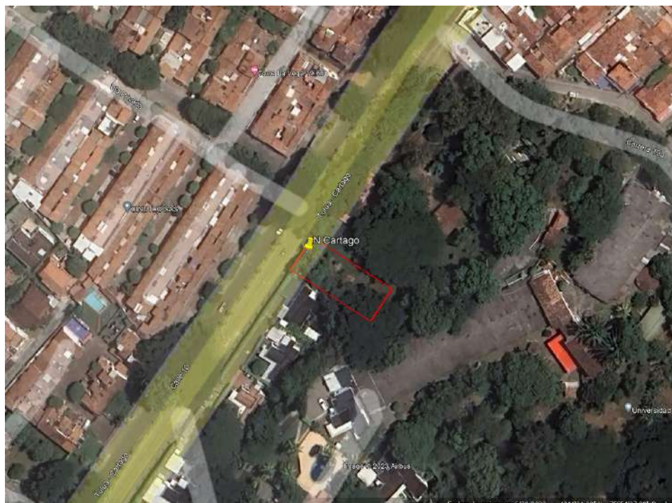
Imagen satelital No. 1