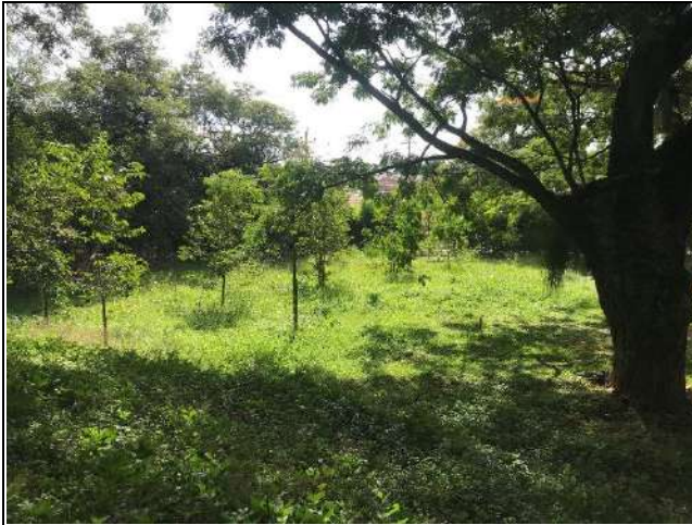
Fotografía 2 Área sujeta a intervención.

A continuación, se plasma un registro fotográfico del área a intervenir y sus alrededores.