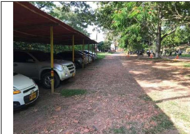
Fotografía 3 Zona de parqueadero contiguo al sitio de intervención

Los árboles presentes en la zona, corresponden a frutales, con CAP menores a 32.5cm, los cuales pueden ser aprovechado sin la solicitud de un permiso de aprovechamiento forestal.