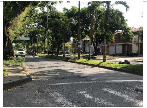
Fotografía 4 Panorámica calle 10 y Barrio Torre la Vega.