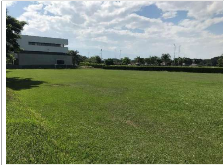
Fotografía 1 Panorámica del terreno sujeto a intervención.