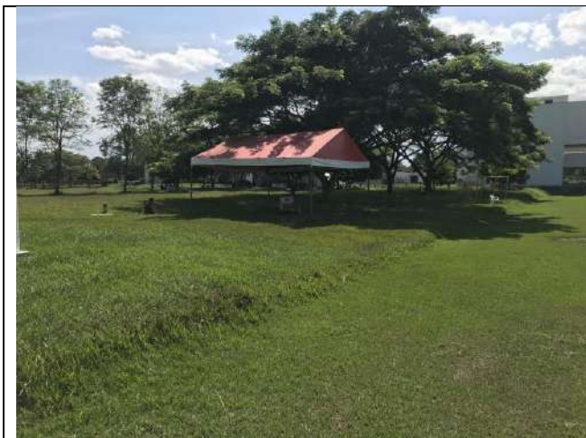
Fotografía 4 Arboles aislados cercanos al sitio de intervención