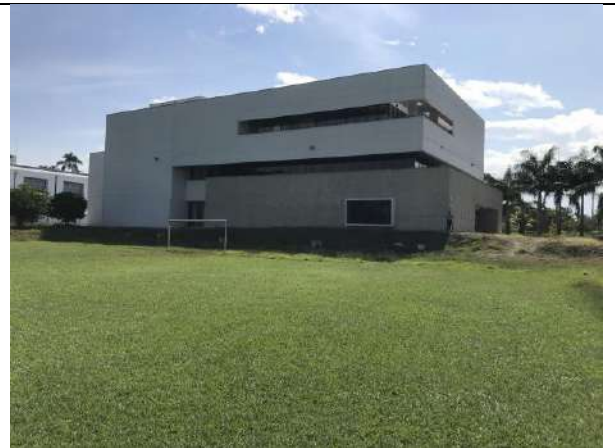
Fotografía 3 Infraestructura cercana al sitio de intervención