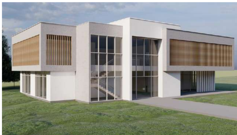
Imagen No. 2 Presentación Volumétrica

El proyecto distrito de innovación en el Nodo Palmira, es una edificación construida en niveles, con materiales duraderos, con un sistema estructural aporticado, cimentación en zapatas con vigas en concreto reforzado, mampostería tradicional (ladrillo), losas en steel deck, cubiertas livianas en Ecoroof, ventanería en aluminio, barandas de pasamanos y vacíos en acero, cortasol en pvc tipo madera entre otros materiales para acabados.