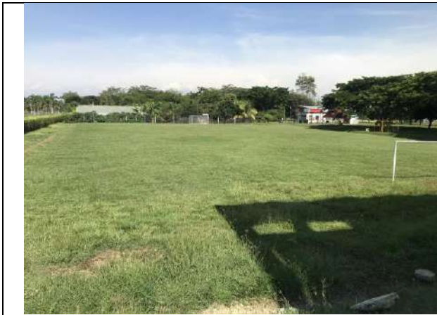
Fotografía 2 Panorámica de la zona sujeta a intervención.