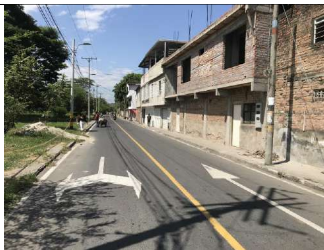
Fotografía 7 Carrera 31ª y viviendas del barrio Zamorano