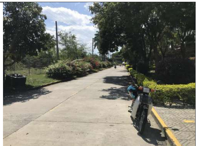
Fotografía 5 Vía interna de acceso