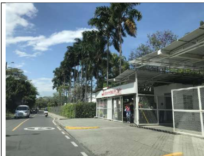
Fotografía 6 Vía externa carrera 31ª y portería de la Universidad